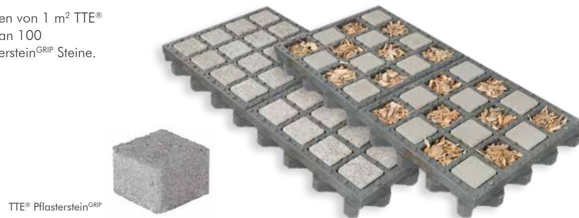
TTE® Pflasterstein GRIP

Zum Befüllen von 1 m 2 TTE® benötigt man 100 TTE® Pflasterstein GRIP Steine.